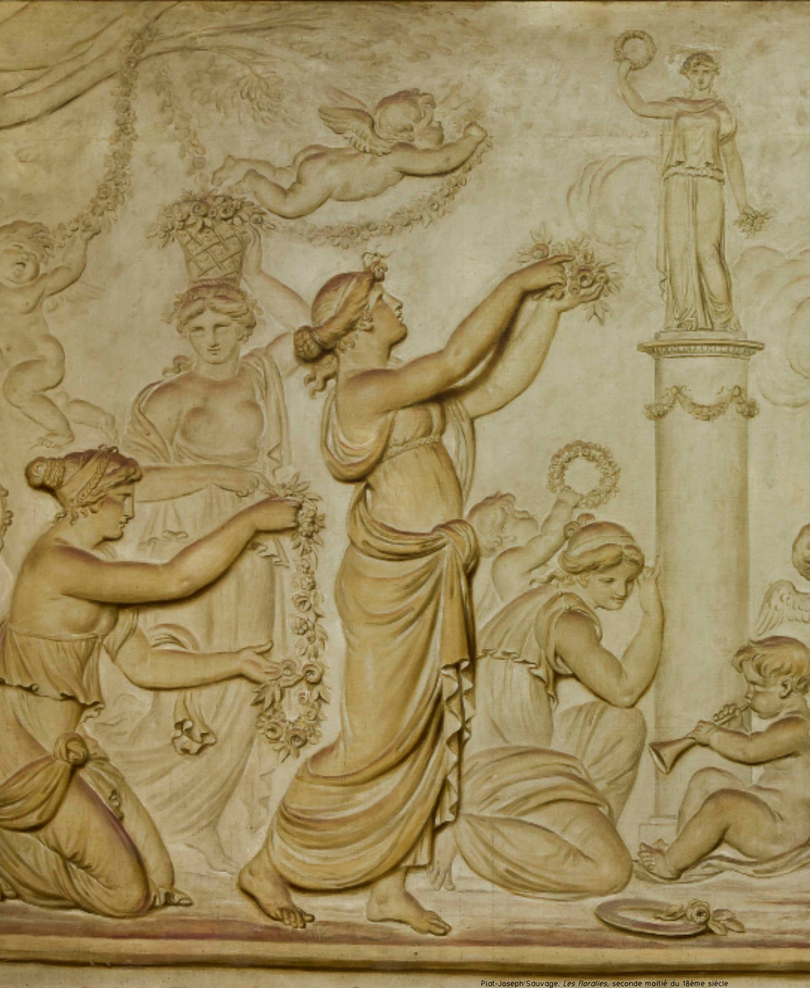
Piat-Joseph Sauvage. Les Florales . seconde moitié du 18ème siècle