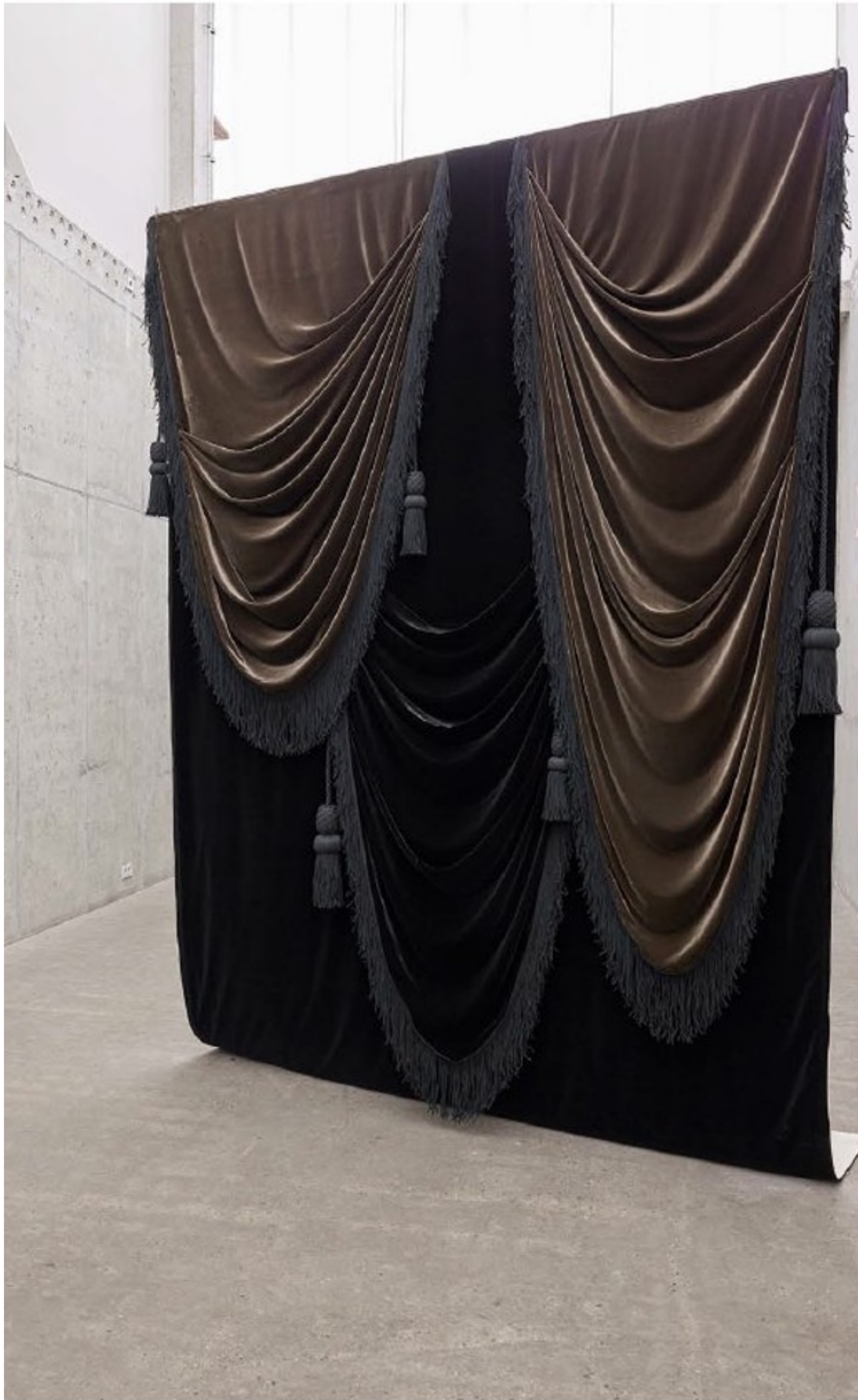
Philippe Schwinger & Frédéric Moser Lincoln's Funeral , 2018 cotton fabric, velveteen, silk velvet passements